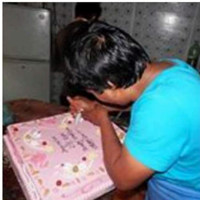
Foto 2014 | DRC: In gebruikname nieuwe ruimte / Inauguration new room | Helping Hands 4 Smiling...

The exercise/studieroom in the DRC Nepal is finished. The new build was inaugurated during a Nepali new years party. This is 4SmilingFaces' biggest project to date. We are beyond proud of realizing this project.